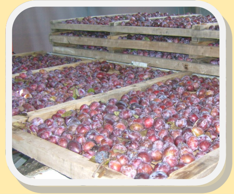
Bandejas a la salida de la línea