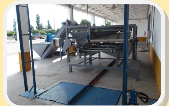
Líneas de llenado con fosa para carga de carros