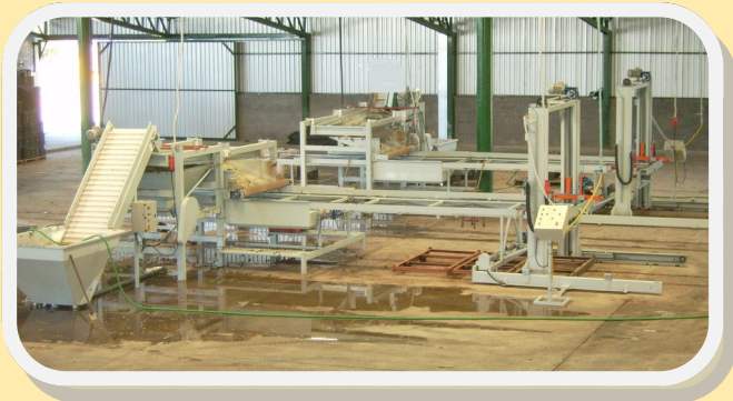
Líneas de llenado con apiladores de bandejas